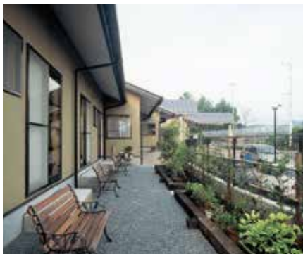
のんびりと過ごせる、グループホームのお庭。