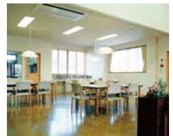
デイサービスフロアー。

私たちは、ご利用者の1日を大切にし、心と心が繋がったあたたかいサポートをいたします。