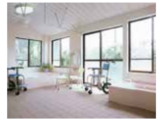
デイサービス浴室。