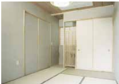
おひとり、おひとりのプライバシーを守る個室は全て約8畳のゆったりとした広さです。