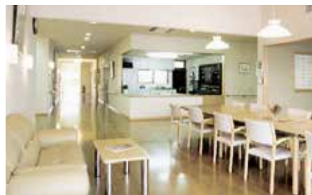
家庭と同じグループホームの居間。テレビを見たり、おしゃべりしたり、洗濯物をたたんだり…。