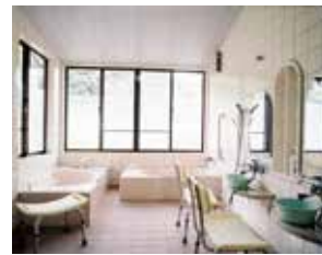
グループホーム浴室。